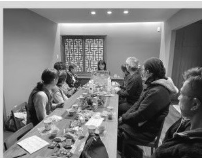
12月為二次避難到 金沢的災民辦聖誕會