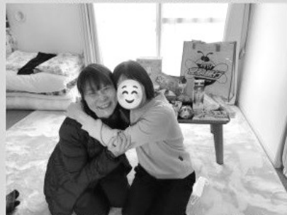
2月帶食物銀行包探訪災民