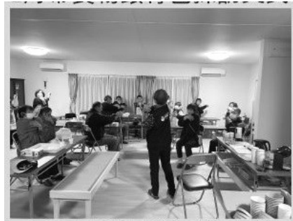
3月在臨時房屋集會所 帶災民做心理健康操