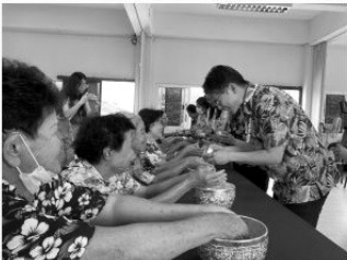
宋干節尊榮長者浴手禮