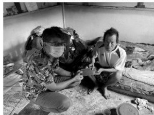
探望關懷孤苦無依的村民