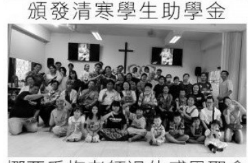
挪亞香梅老師退休感恩聚會