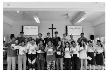
頒發清寒學生助學金