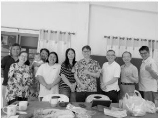
地方教會差會長老來探望