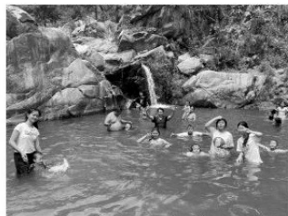
暑期兒童夏令營活動