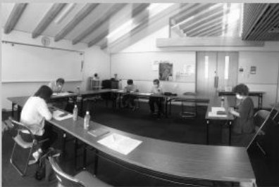
東名野蒜開拓的會議

願我們今年都經歷神在我們生命中所做的新事！願主在日本屬靈的曠野開道路，在日本福音的沙漠中開江河！