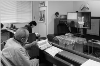
菅吾老先生第一次到教會崇拜