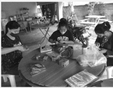
收購布口罩後包裝成袋