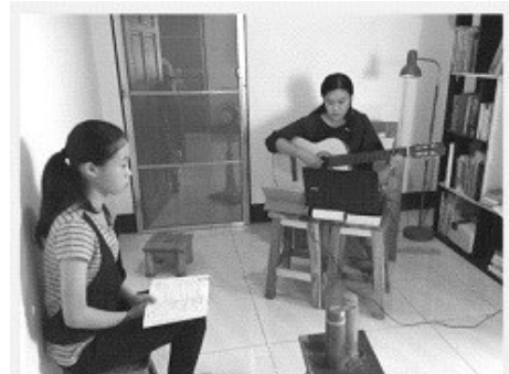
第一次網路直播主日

2020 年是我們一家進入跨文化宣教的第七年，想不到今年卻因新型冠狀病毒肺炎的肆虐，造成全球極大的災難及恐慌。「七」在聖經中是很特別的數字，極具象徵性的意義。猶記一月初時，在某日清晨的禱告祭壇中，主說，「若有人服事我，就當跟從我；我在哪裏，服事我的人也要在那裏；若有人服事我，我父必尊重他。」（約翰福音十二 26）。我們把主的話存記在心中。後來隨著肺炎的疫情從中國開始快速擴散至全世界，包括泰國及我們的家鄉—台灣，我們不得不取消原本三月底預計返台探親的行程。說真的，在確定無法返台探親後，我們還蠻失落的，因早已計畫不少行程，期待見到想念的家人親友、教會肢體，還有品嚐台灣美食…。不過，想到主早已顯明祂的心意，指示我們留在泰北，來服事主耶穌及在泰北的百姓。我們迅速調整心情，預備與主同工。