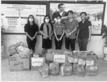
代表基金會捐贈物資給社會局

在充實無比。終於在五月初，我們收到泰國基督教總會來信，指示在作好防疫措施的前提下，經村長同意後，教會就可以開始實體聚會了。於是我們去拜訪了村長，村長帶衛生部門的人員來視察，他們對我們的防疫措施很滿意，福泰禮拜堂在 5 月下旬恢復實體聚會，也在六月恢復小組聚會。