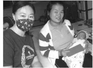
探望剛生產的姐妹