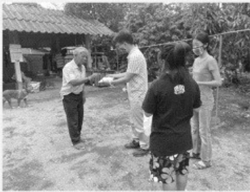
發送自製的布口罩給社區百姓