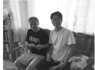
帶領鄰居長輩信耶穌