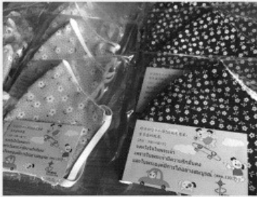
收購布口罩後包裝成袋