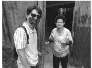
探望獨居的教會肢體

感謝主的憐憫，泰國的疫情在近期得到較好的控制。我們所居住的清萊省已有四週多沒有新增肺炎確診案例。所有確診病人也都順利康復出院。泰國政府正逐步按階段開放中。而在這段居家防疫期間，我們全家一起訂行事曆：讀聖經、抄經文、讀屬靈書籍、學語言、學數學、玩桌遊、跳繩、健身、打陀螺、作美食等等，實